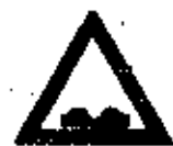
Un simbolo più plausibile

La Gazzetta di Egalia non si preoccupò neppure di recensire il libro. La maggior parte delle collaboratrici di questo giornale solevano leggere libri di questo tipo a casa sotto le coperte. La prima frase del libro, "Dopo tutto sono le donne che partoriscono la prole," ripetuta successivamente fino alla noia, era già di per sé sintomo di repressione sessuale. Come se il partorire fosse qualcosa di sospetto! O come se fosse pensabile che un'opinione del genere potesse trovar posto in un'argomentazione logica e seria! Data la reputazione del quotidiano come organo obiettivo e razionale della madrematria per tutte le questioni importanti, il libro non venne neppure nominato.